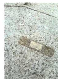
↑(私の中でだけ)話題の絆創膏がこちらです。

小呂野もより時間をかけ、醸成を図り、組織の一体感を高めてまいります。 KONISHI