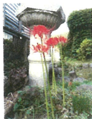
蔓珠沙華 : 情熱の花。

コロナウイルスの影響により、会員の みなさん、地域の方々向けの小呂野塾開 催については、実施ができない状況が続 いております。